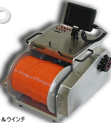
300mケーブル&ウインチ