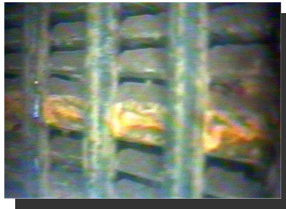
ストレーナー目詰まり