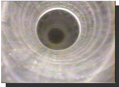
ケーシング接合状況