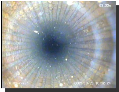
スリット状況(前方)