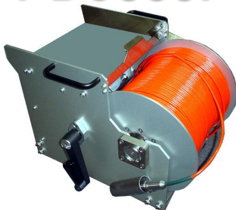
300mケーブル&ウインチ