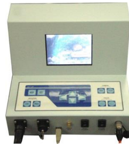
モニタ内蔵コントローラー300mケーブル&ウインチ