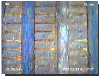
スリット状況(側方)