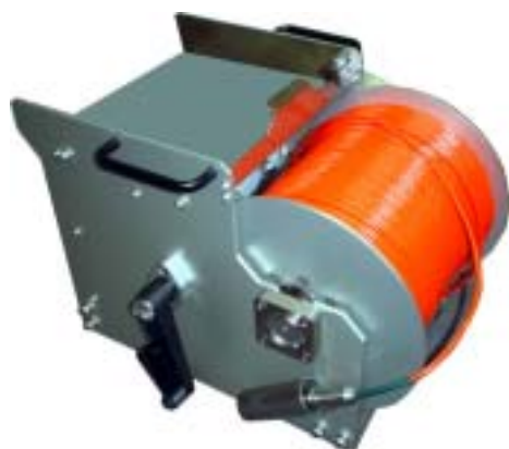
300mケーブル&ウインチ