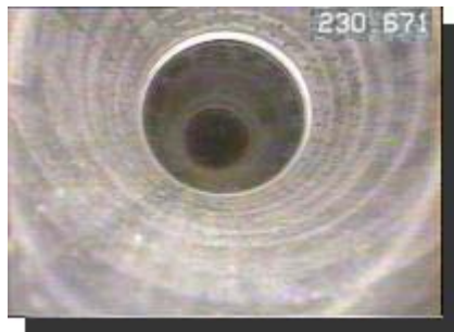
ケーシング接合状況