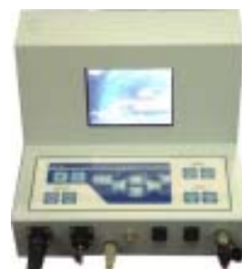
New! モニタ内蔵コントローラー