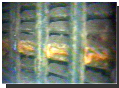
ストレーナー目詰まり