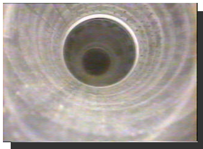
ケーシング接合状況