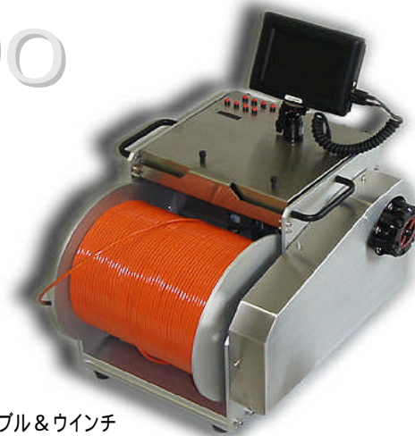
300mケーブル&ウインチ