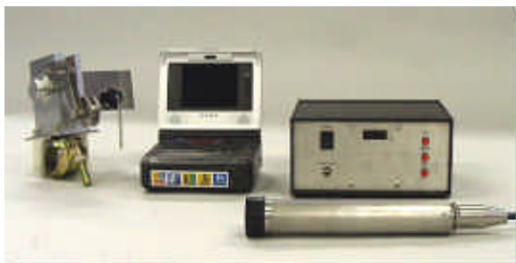
モニター付ビデオデッキはオプション品です

スマートカメラ・SC-200は深度表示機能を搭載した200m対応の前方視カメラです。