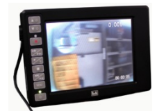
録画機能付モニター