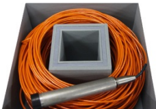
200m ケーブル&ケーブルロープ