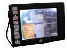
録画機能付モニター