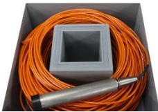
200m ケーブル&ケーブル