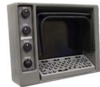
液晶モニター ビデオテキストライター