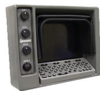
液晶モニター ビデオテキストライター