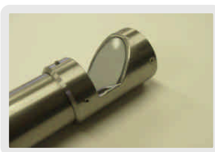
オプション品:側方視ミラー ( 44mm)