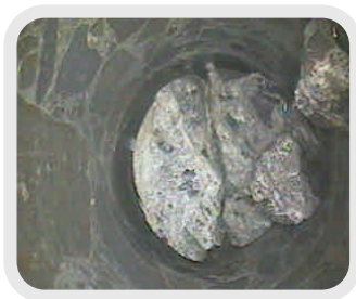
コンクリート構造物観察