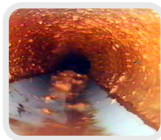
管内観察状況(錆び等汚れ)