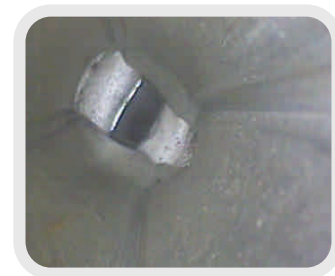
傾斜計ケーシングパイプ変形状況